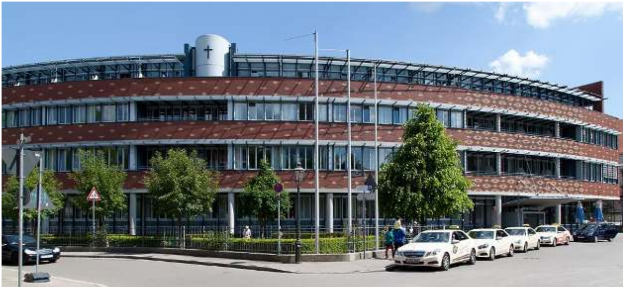
Die Klinik Vincentinum im Herzen der Stadt Augsburg