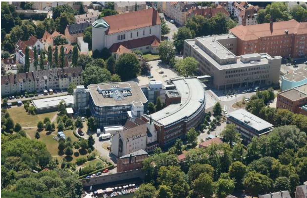
Der Gesundheitspark am Vincentinum